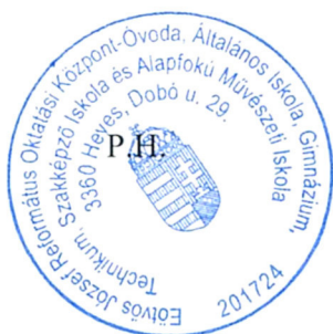
Együd László igazgató